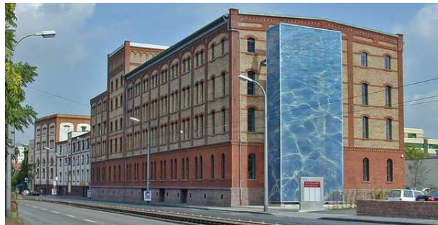
Veranstaltungsort: Hörsaal Alte Brauerei, Käfertaler Strasse 162, 68167 Mannheim